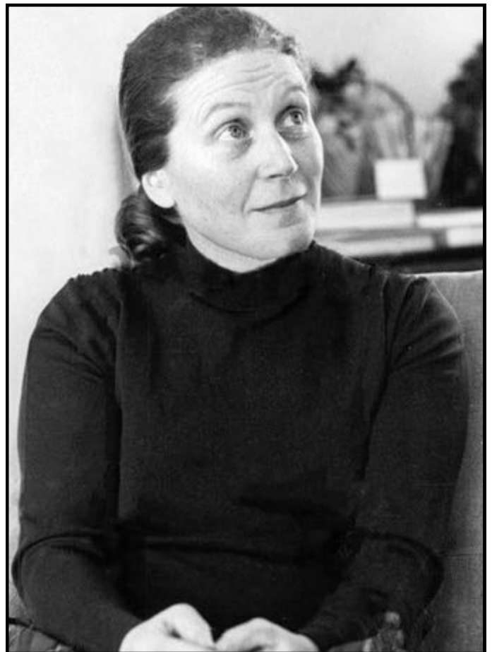
SVETLANA STALINA ALLILOEJEVA