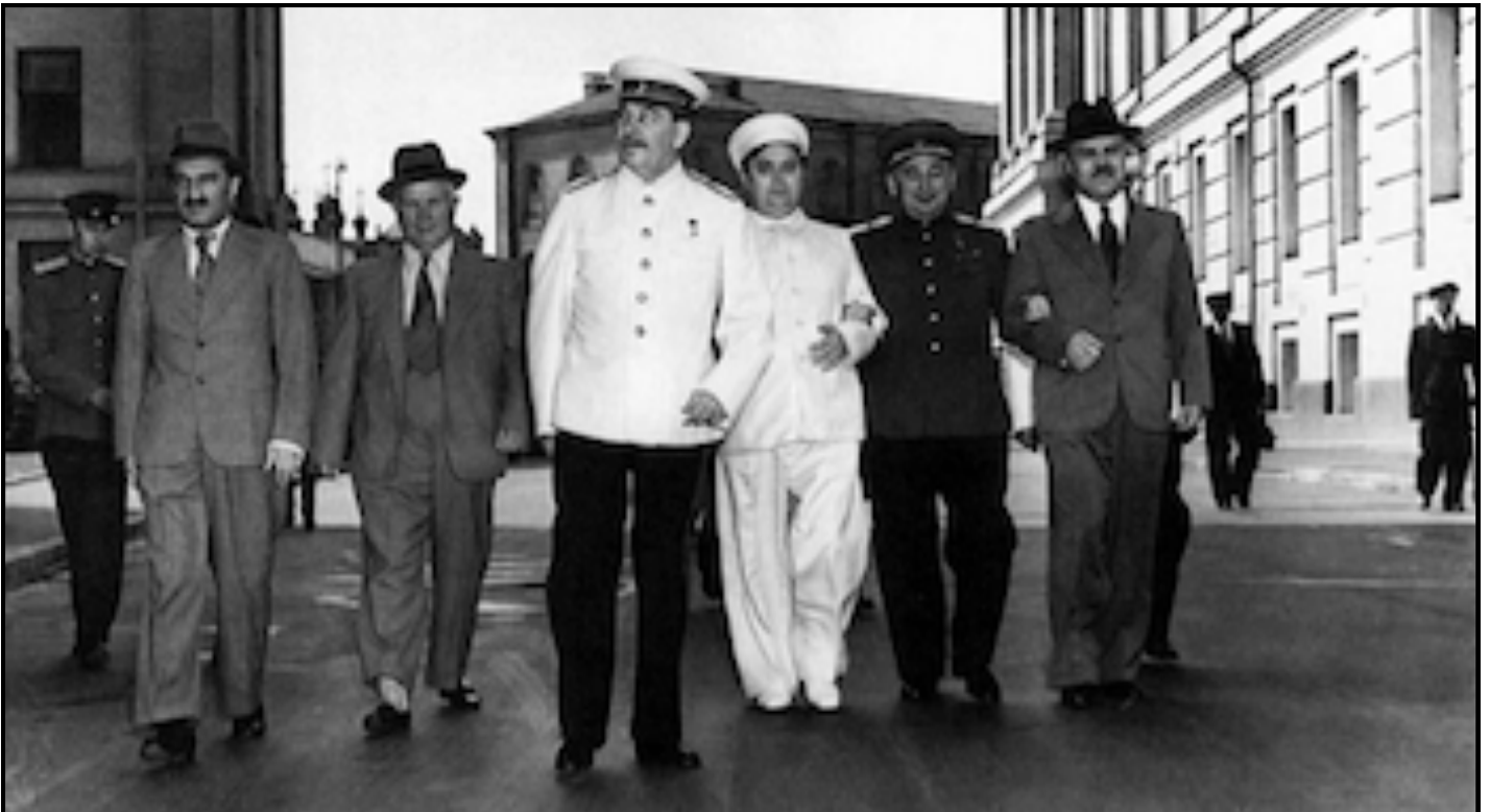
DE OLIJKE BENDE VAN KOENTSEVO. VAN LINKS NAAR RECHTS: ONBEKENDE WACHTER, ONBEKENDE MAN, NIKITA CHROESJTSJOV, JOZEF STALIN, GEORGI MALENKOV, LAURENTI BERIA EN VJATSJESLAV MOLOTOV.

Vjatsjeslav Molotov, de eeuwige stalinist, die al kort na de Oktoberrevolutie (1917) tot de intieme vertrouwenskring van Stalin behoorde. Hun verbondenheid leek decennialang onbreekbaar. Tot Stalin uit antisemitische gevoelens Molotovs vrouw Polina liet deporteren naar de goelag. Hoewel Molotov zelfs dan Stalin trouw bleef, werd zijn macht geleidelijk ingeperkt, verdween hij finaal uit de vertrouwenskring en werd hij geregeld publiekelijk vernederd.